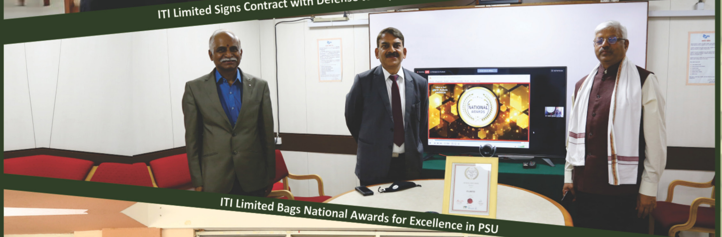
ITI Limited Bags National Awards for Excellence in PSU