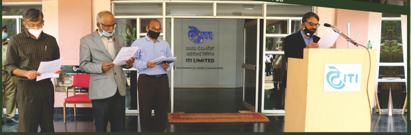
ITI Limited Observes Week-long 'Jan Andolan' Campaign for COVID-19 Appropriate Behaviour

वैश्विक संचार के लिए संपूर्ण समाधान Total Solutions for Global Communications