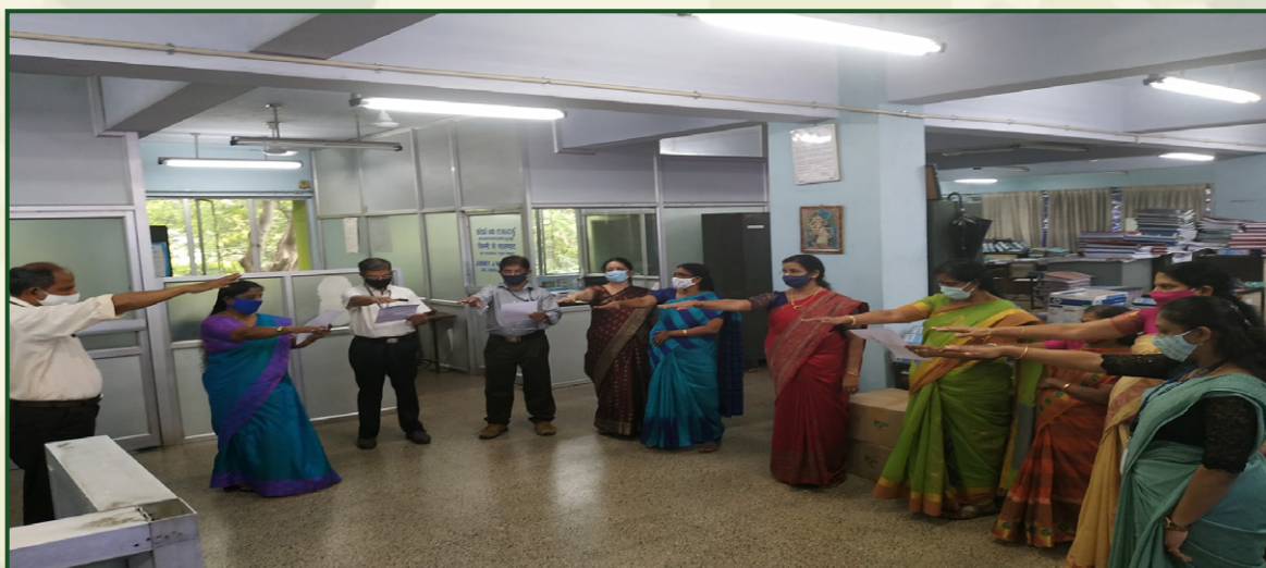
At ITI Palakkad Plant, National Integrity Pledge was administered by HOD's to the officers and employees on October 31, 2020