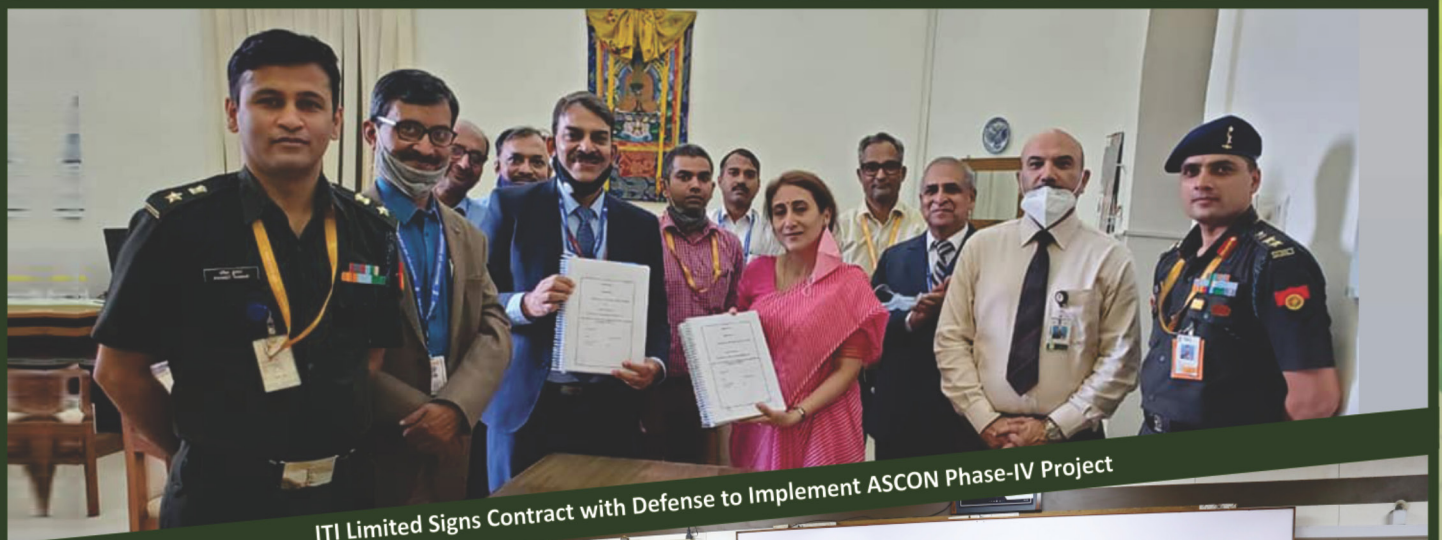
ITI Limited Signs Contract with Defense to Implement ASCON Phase-IV Project